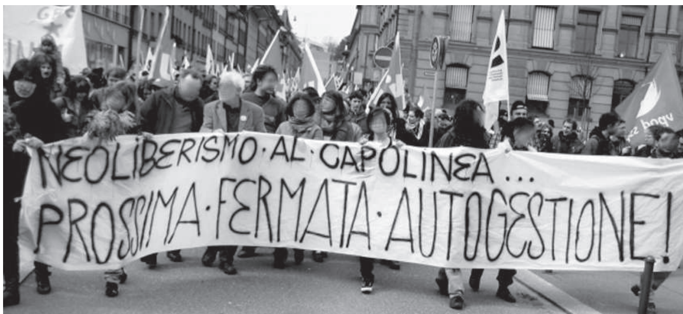
Giù le mani dalle Officine! - Manifestazione a Berna del 19 marzo 2008 - Da indymedia.ch